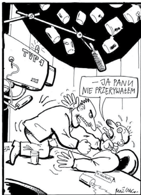
Rys. Andrzej Mleczko

przeczekać powitalnego „dzień dobry”. Przerwał w pół słowa, by wygłosić kilkuminutowe przemówienie będące wariacją na temat „kompletnie nie mam czasu” i „mam do zrobienia to i to”. Postawą odwrotną jest „samoświadomość” (ang. self-awareness ), opisana spostrzeżeniem: „Dżentelmen obraża innych tylko wtedy, gdy tego chce”.