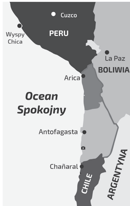
Ryc. 1. Odcinek wybrzeża Peru i Chile zawierający znaczne ilości surowców, w tym guana, saletry i rud miedzi.

Rozwój ich imperium był zasilany wydajnością upraw takich jak ziemniaki i komosa ryżowa. Polowanie na ptaki wytwarzające guano – m.in. kormorany, pelikany i sule – było karane śmiercią. Ptaki te żywiły się nadzwyczajnie bogatymi ławicami ryb ekosystemu Prądu Peruwiańskiego. Przetwarzały je na bezcenny nawóz, który Inkowie rozdzielali poprzez skomplikowany obyczajowo i prawnie system dystrybucyjny.