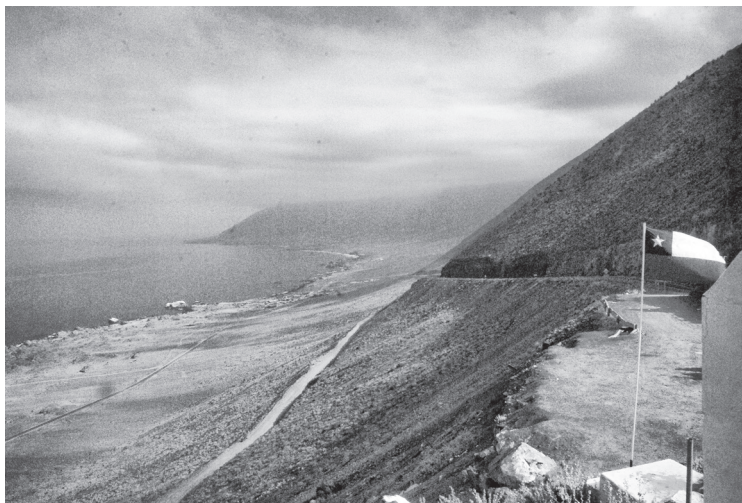
Fot. 1. Wybrzeże Chile w okolicy miasteczka Paposo. W głębi lądu znajdują się liczne kopalnie rudy miedzi i innych metali.

W rejonie współczesnego Peru nadzwyczajną wydajność ptasiego guana w charakterze nawozu docenili już Inkowie.