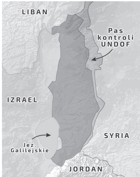
Ryc. 2. Rejon Wzgórz Golan

Rejon ma dla Izraela wieloaspektowe krytyczne znaczenie. Jego kontrola jest dla Izraela formą pozyskania głębi strategicznej w kontekście inwazji ze strony Syrii. Największą jednak zaletą kontroli nad wzgórzami jest stworzenie dodatkowego bufora dla arabskich wyrzutni raketowych, które mogą ostrzeliwać resztę Izraela. Część Syrii przylegająca do Wzgórz Golan jest aktualnie (2023 r.) kontrolowana przez wojska rządowe, jednak od 2011 do 2018 była pod kontrolą rebeliantów.