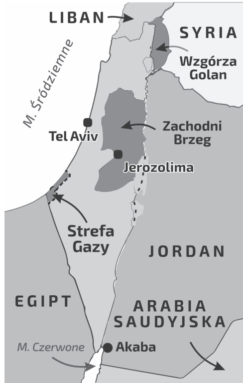
Ryc. 1. Izrael i jego sytuacja geopolityczna